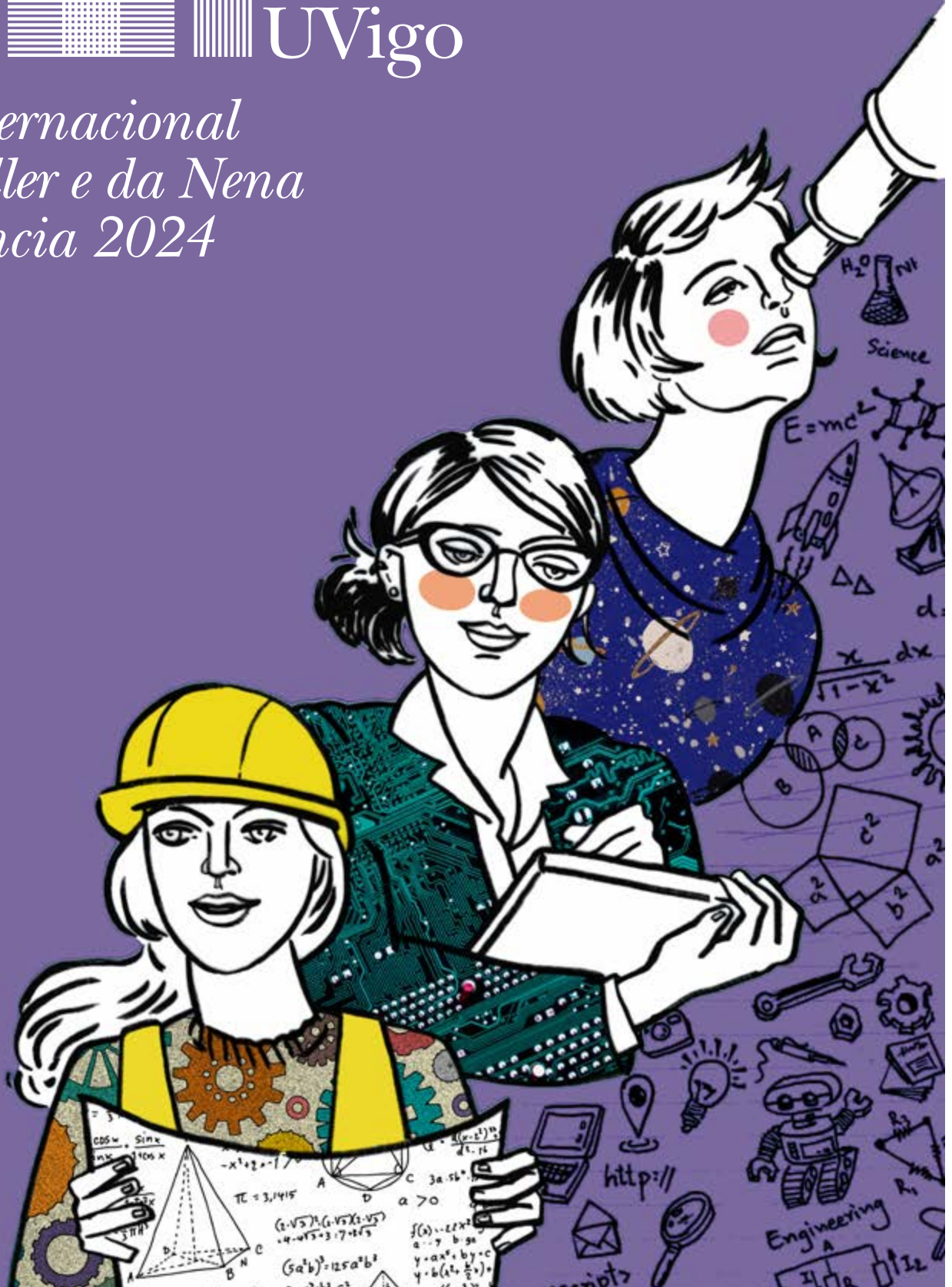
Ilustración: Marta Riera. Diseño: Área de Imaxe, Vicerreitoría de Comunicación e Relacións Institucionais